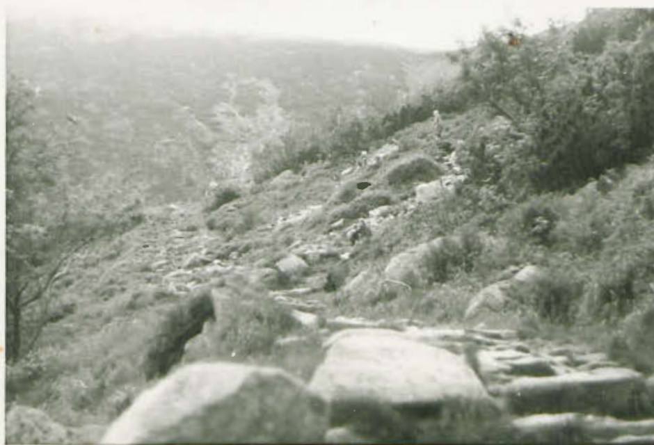
Typowy szlak wędrownki obozu.