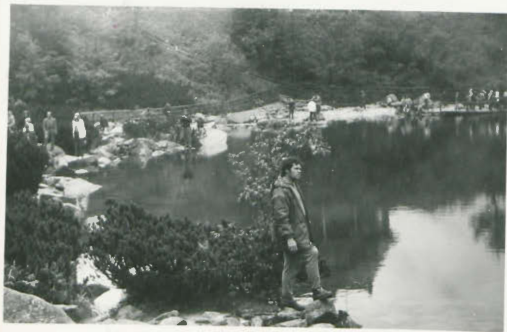
Nad Morzkim Oknem.