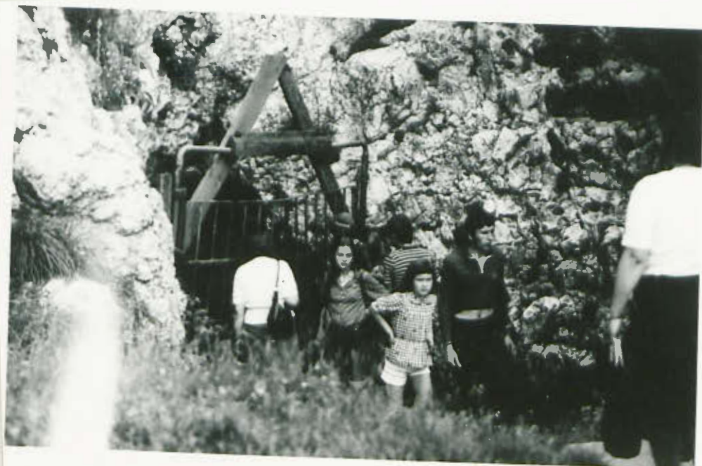
Kraków - smocza jama