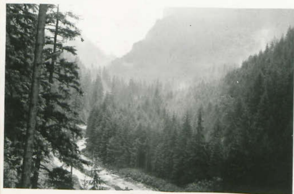
Szlak turystyczny na Giewont.