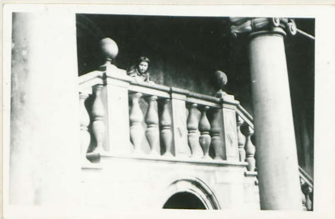
Dziędziwiec U. Jagiellońskiego