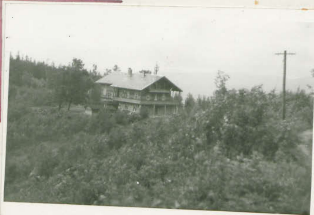
Schronisko na Kalatowce.