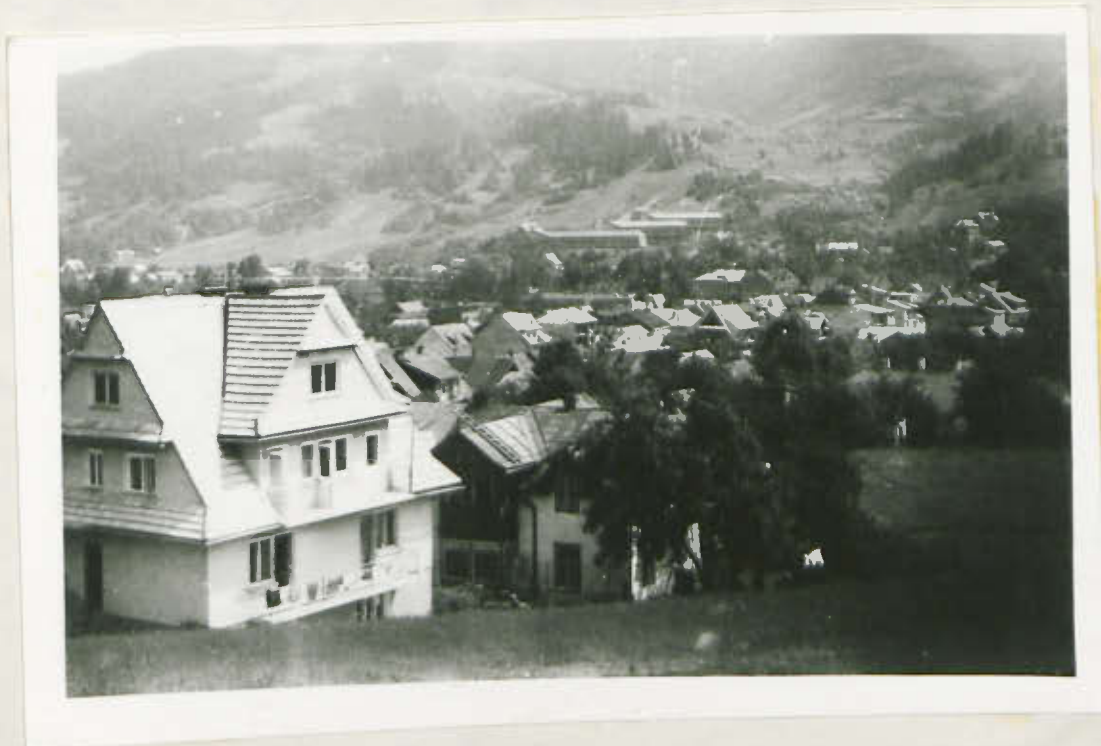
SZCZAWNICA - KROŚCIENKO PANORAMA