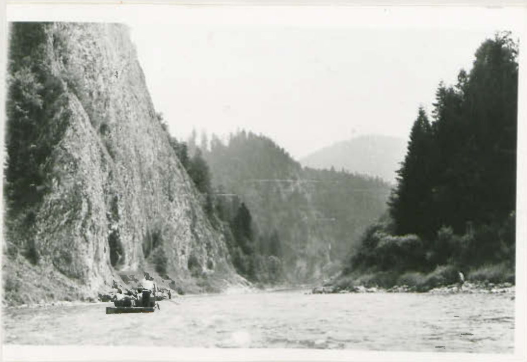
LEGENDARNY „JANOSIKOWY SKOK”