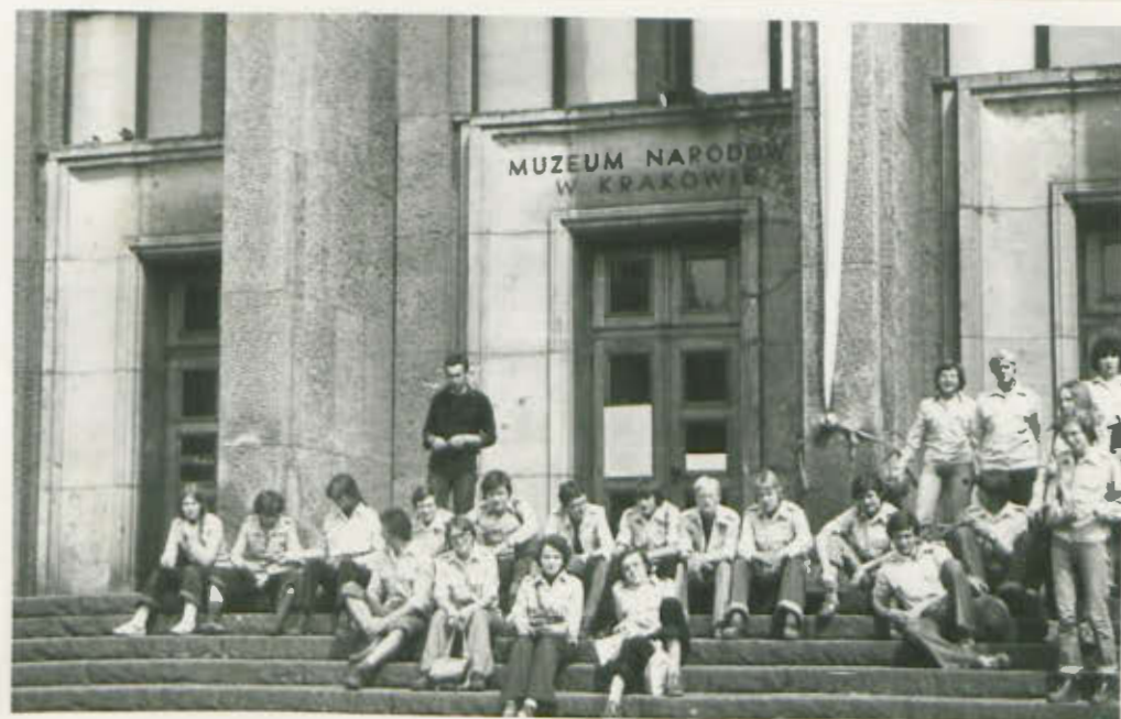
GALERIA SZTUKI XXW.