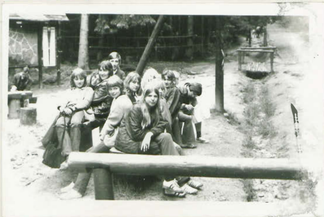
W oczekiwaniu na pojazd.