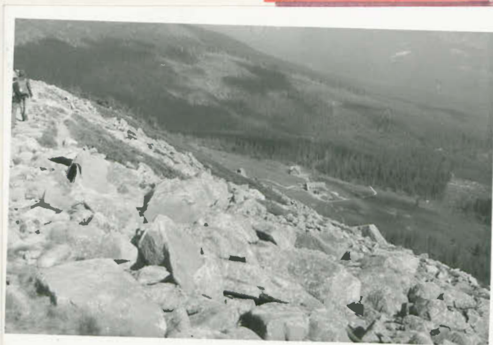
Panorama gór na szlaku.