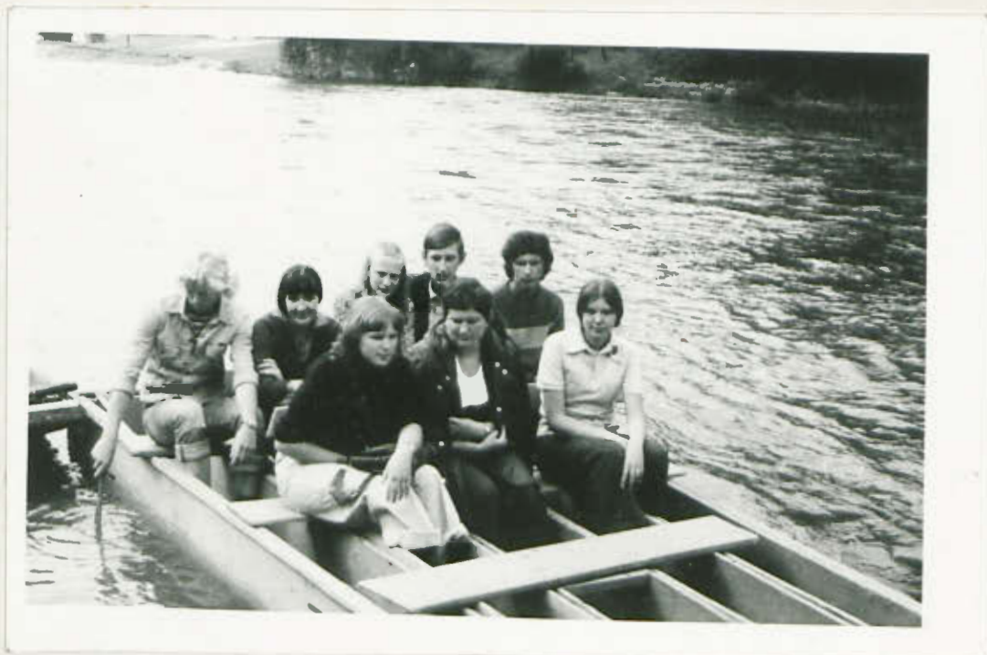
Atrakcyjna wycieczka do Czorsztyna spływ Durajem.