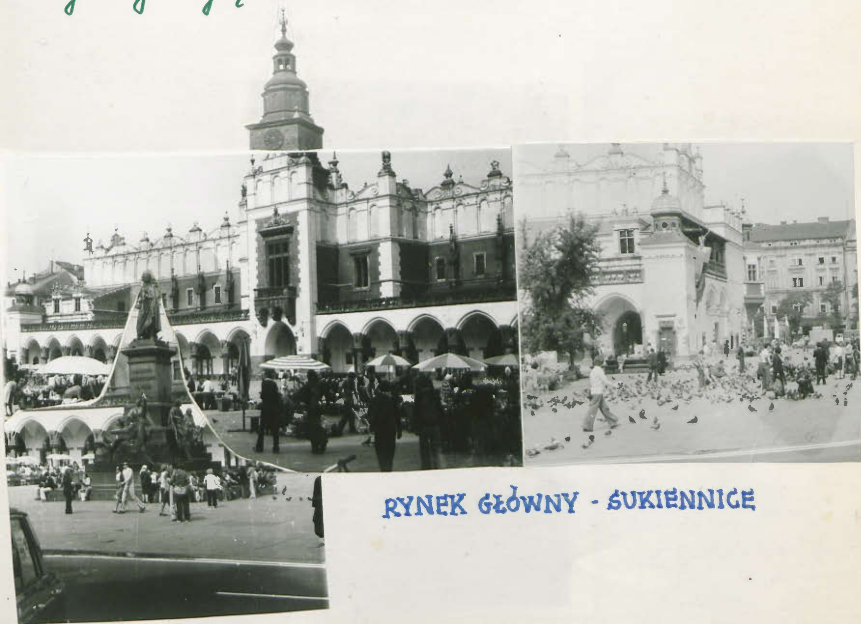
RYNEK GŁÓWNY - SUKIENNICE

Wiele czasu poświęciliśmy na spacer po rynku. Odwiedziliśmy stoiska w su- kiennicach. Obejrzeliśmy obrazy w Galerii. Nie zapomnieliśmy o siódmokach zawsze głodnych gołębi.