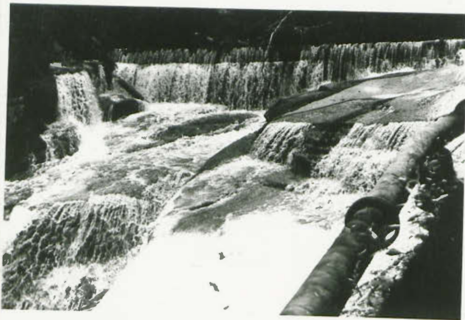
Podziwiamy kaskady na rzekach górskich.