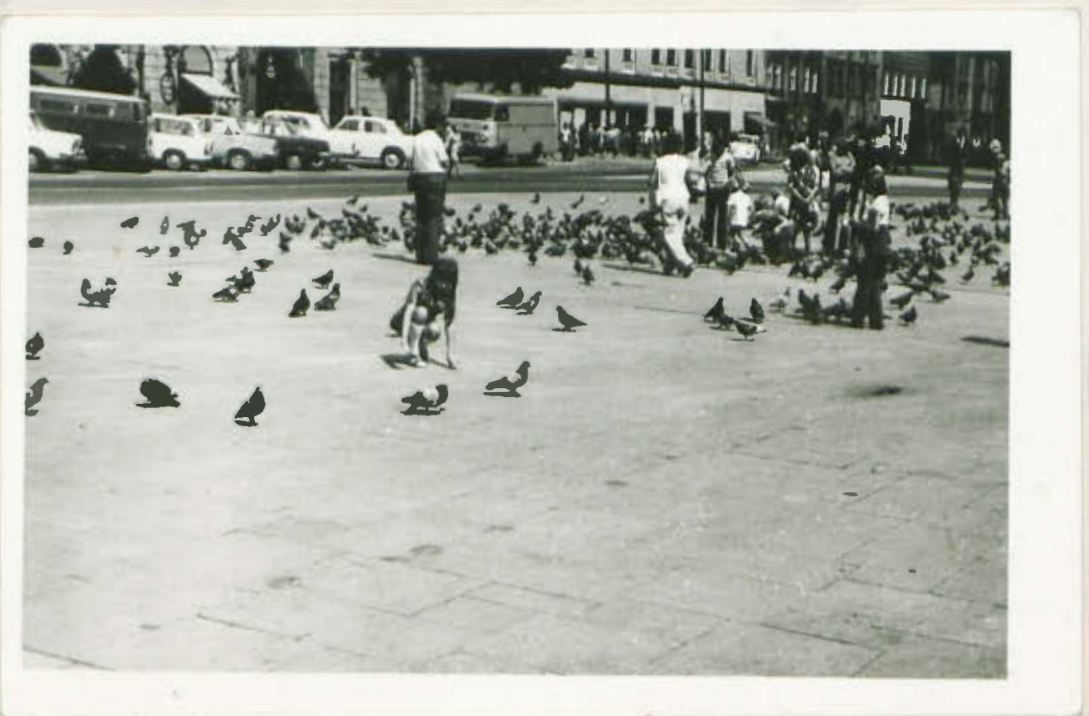
Na krakowskim rynku.