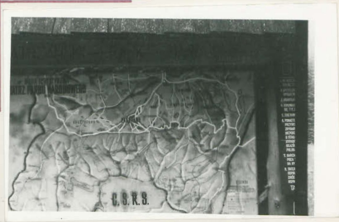
Tatrzański Park Narodowy - mapa plastyczna na szlakach.