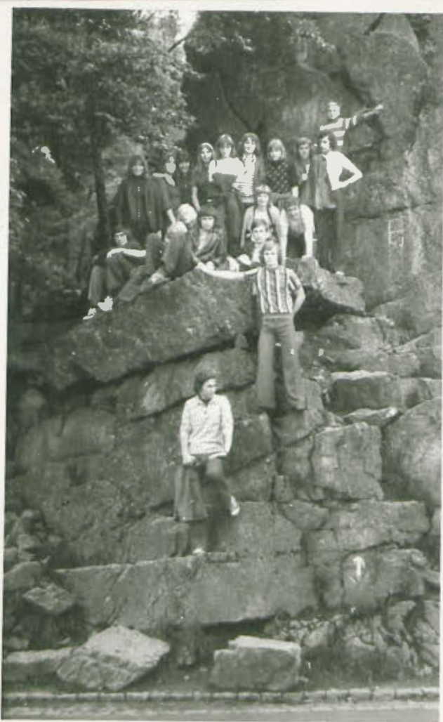
Pamiątkowe zdjęcie grupy obozowej.