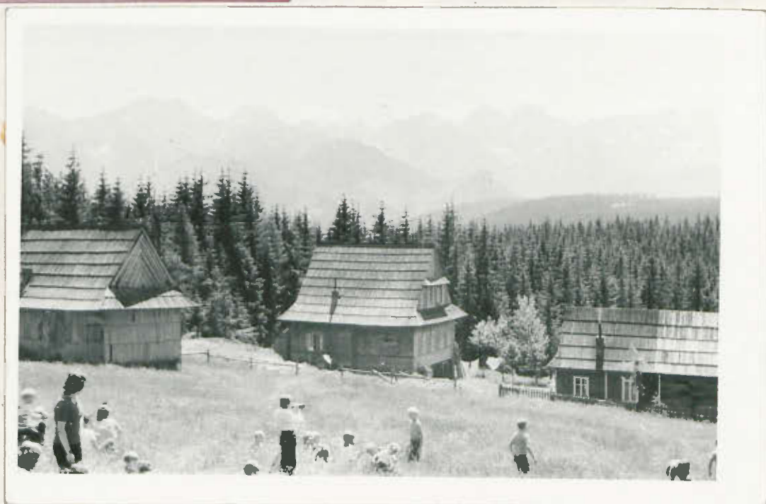
Typowy krajobraz wsi koło Zakopanego.