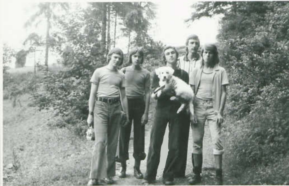
Ulubiony towarzysz wędrówek.