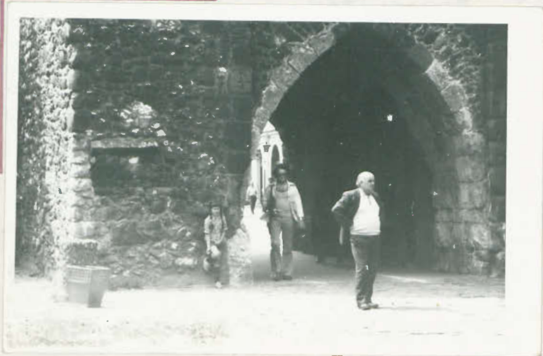
Kraków - Brama Florian'ska