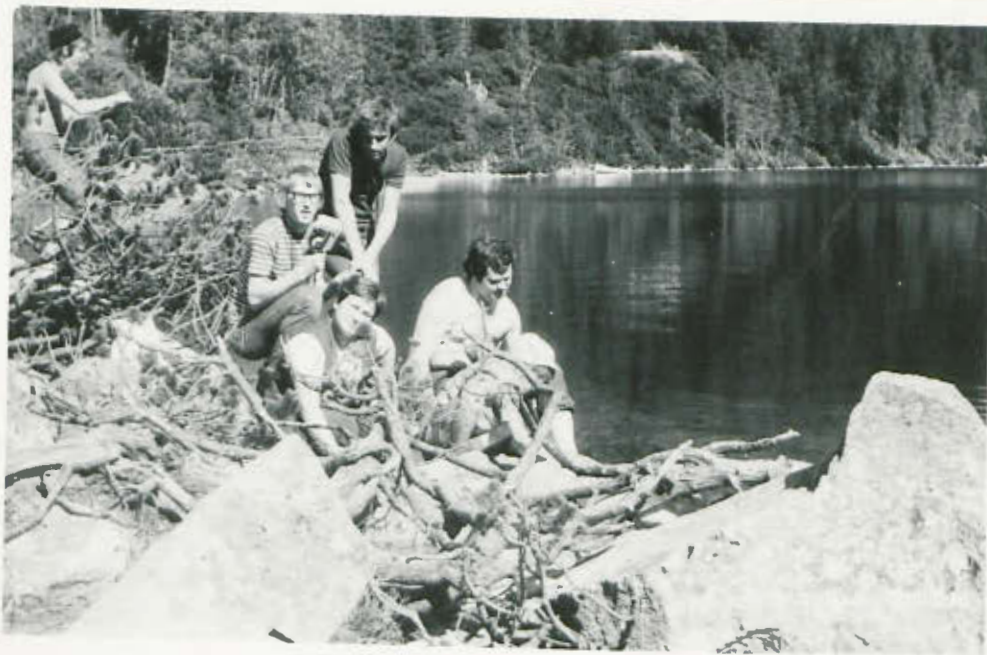
Obserwujemy pstrągi w lustrzanej wodzie M. Oka.