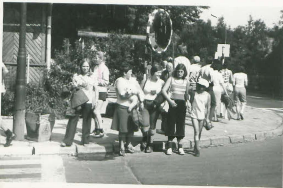
Spacer po ulicach Zakopanego.