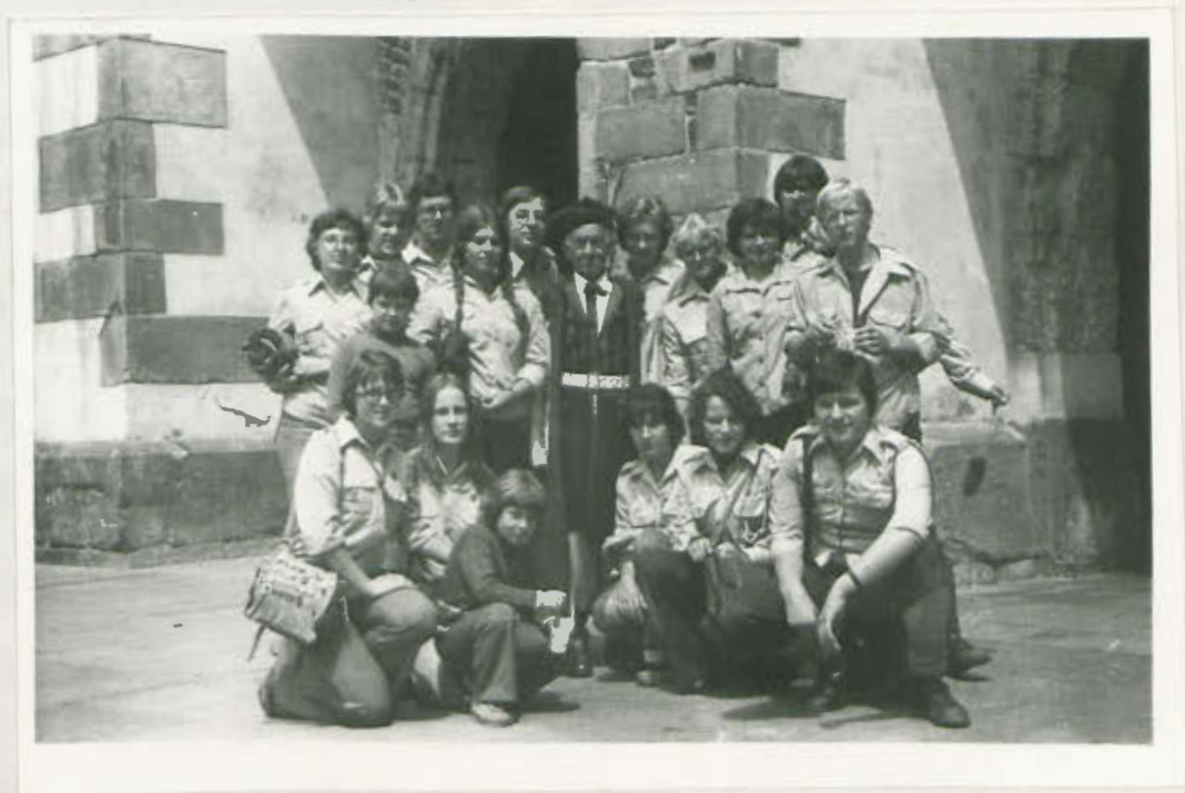
UCZESTNICZY OBOZU PRZED SUKIENNICAMI

Nie obyło się bez pamiątkowego zdjęcia z Krakowiakiem.