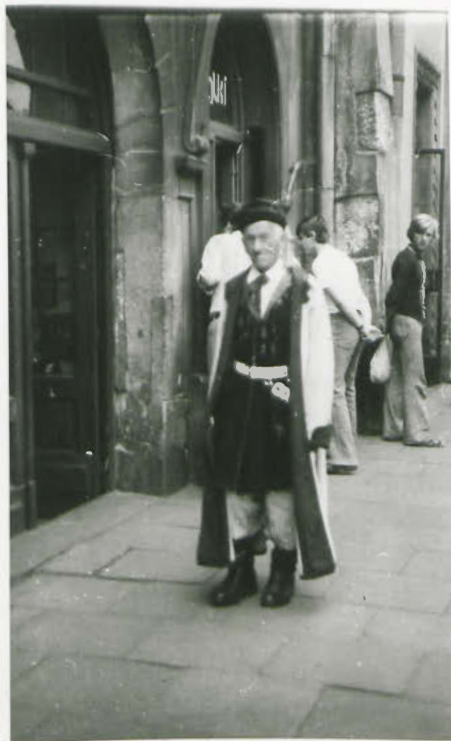
REGIONALNY STRÓJ KRAKOWSKI

Poznawaliśmy regionalny folklor krakowski. Wiele nam opowiadano i śpiewano. Lepiej jednak jest zobaczyć coś na własne oczy. Z ciekawością więc oglądaliśmy męską w stroju krakowskim przy Sukiennicach.