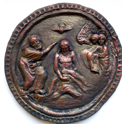
Lucyna Smok Pracownia Artystyczna Rogalinek