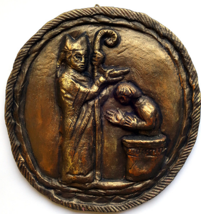
Pracownia Artystyczna Rogalinek

witraż, olej, mal. na drewnie, mozaika, rysunek, haft krzyżykowy