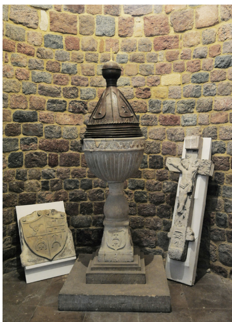
Tum pod Łęczycą