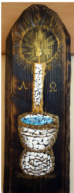
Pracownia Artystyczna Rogalinek (2x)