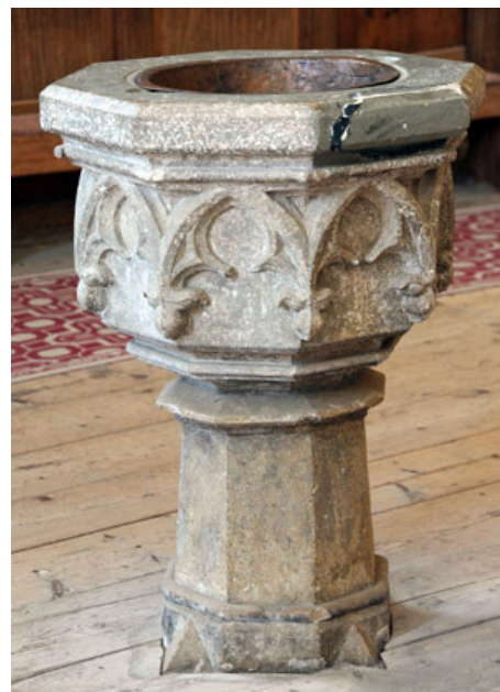
fot. Attila Mudrak - Węgry (x3)