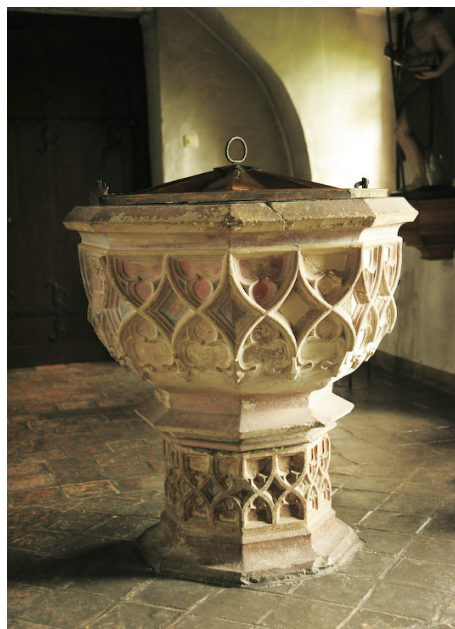
Eberbach - Niemcy