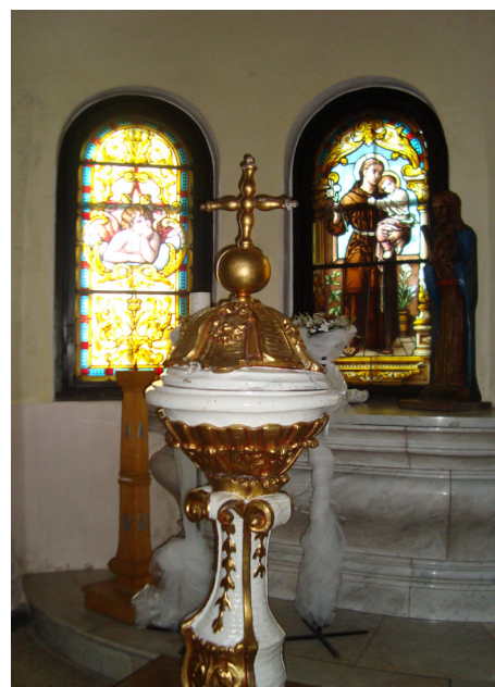
Czarniejewo (x3)