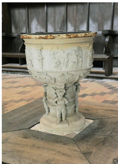
Havelberg - Niemcy