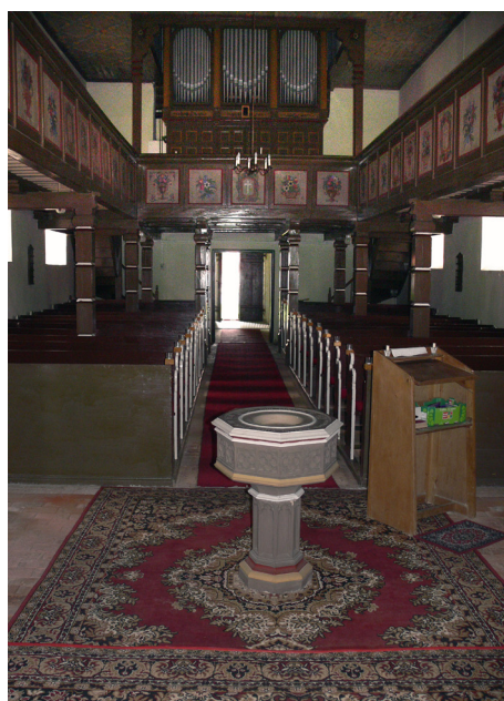
Petkuser - Niemcy