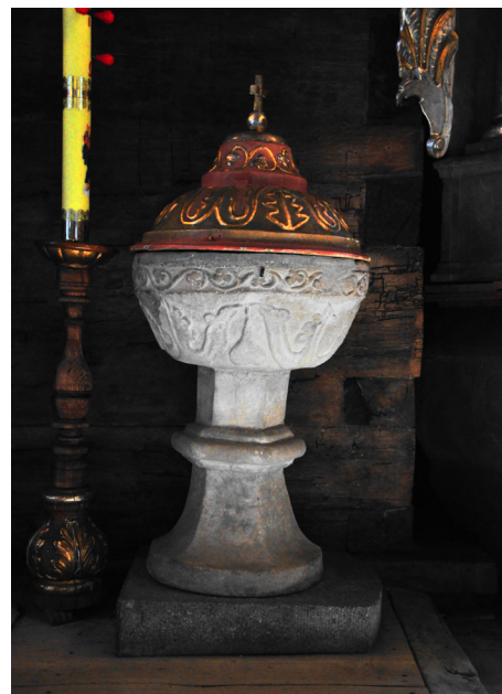
Łubowo fot. Agnieszka Filipiak (x3)