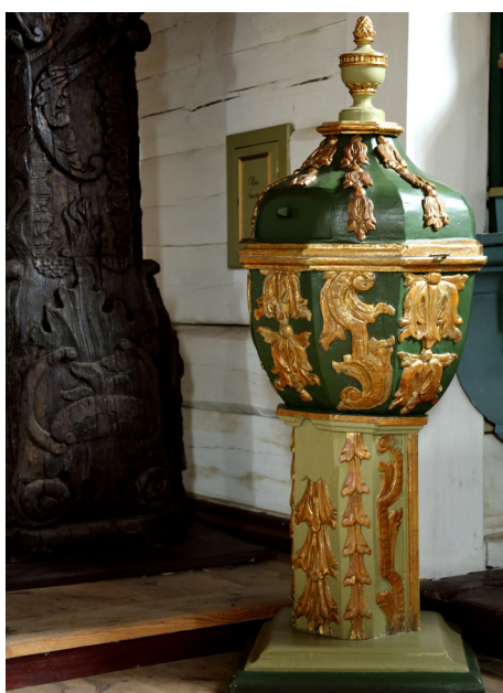
Dzieskanowice, fot. Paweł Kostusiak