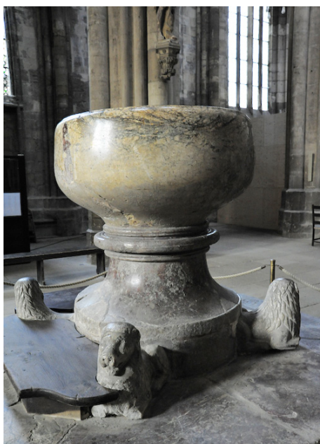
Halberstadt - Niemcy