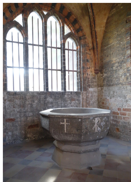
Chojno, fot. Władysław Nielipiński